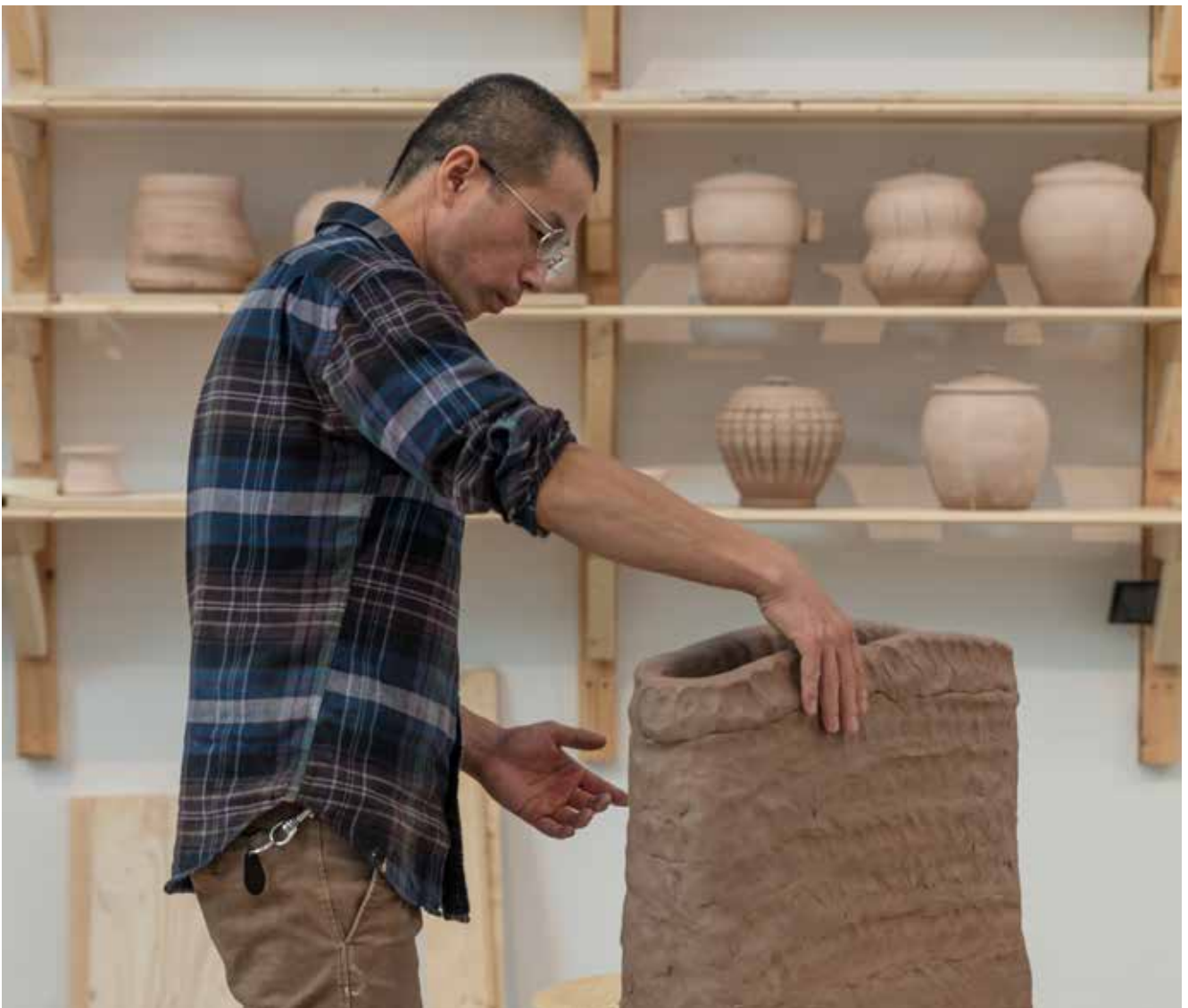
Theaster Gates, Soul Manufacturing Corporation , 2018, Bonniers Konsthall.

Som en del av verket har ett så kallat Care Program (omvårdnadsprogram) tagits fram, som erbjuder mästarna och lärlingarna olika typer av omvårdnad. Två gånger i veckan, varvat med arbetet, kommer de bland annat att få handmassage, högläsning eller musikaliska framföranden. En del av programmet kan även du som besökare ta del av.