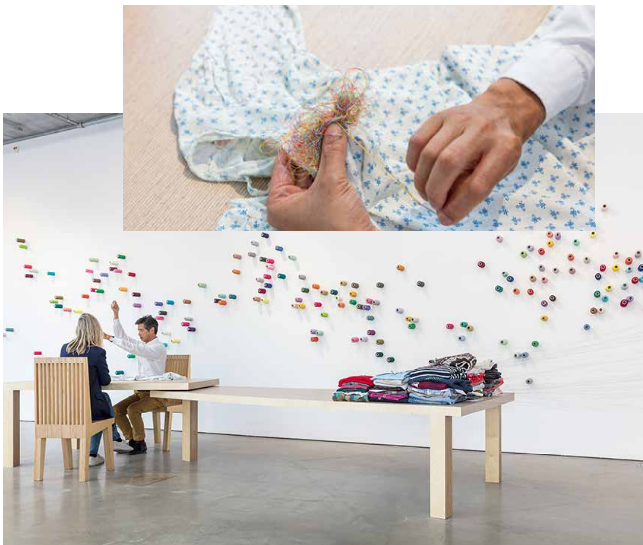
Lee Mingwei, The Mending Project, Bonniers Konsthall.

Ta med dig ett plagg hemifrån, gärna något som du har burit mycket. Dela in er i mindre grupper och berätta vad det här plagget betyder för dig. Kommer du ihåg när du bar det första gången? Har du fått plagget av någon, i så fall vem? När brukar du ha på dig det?