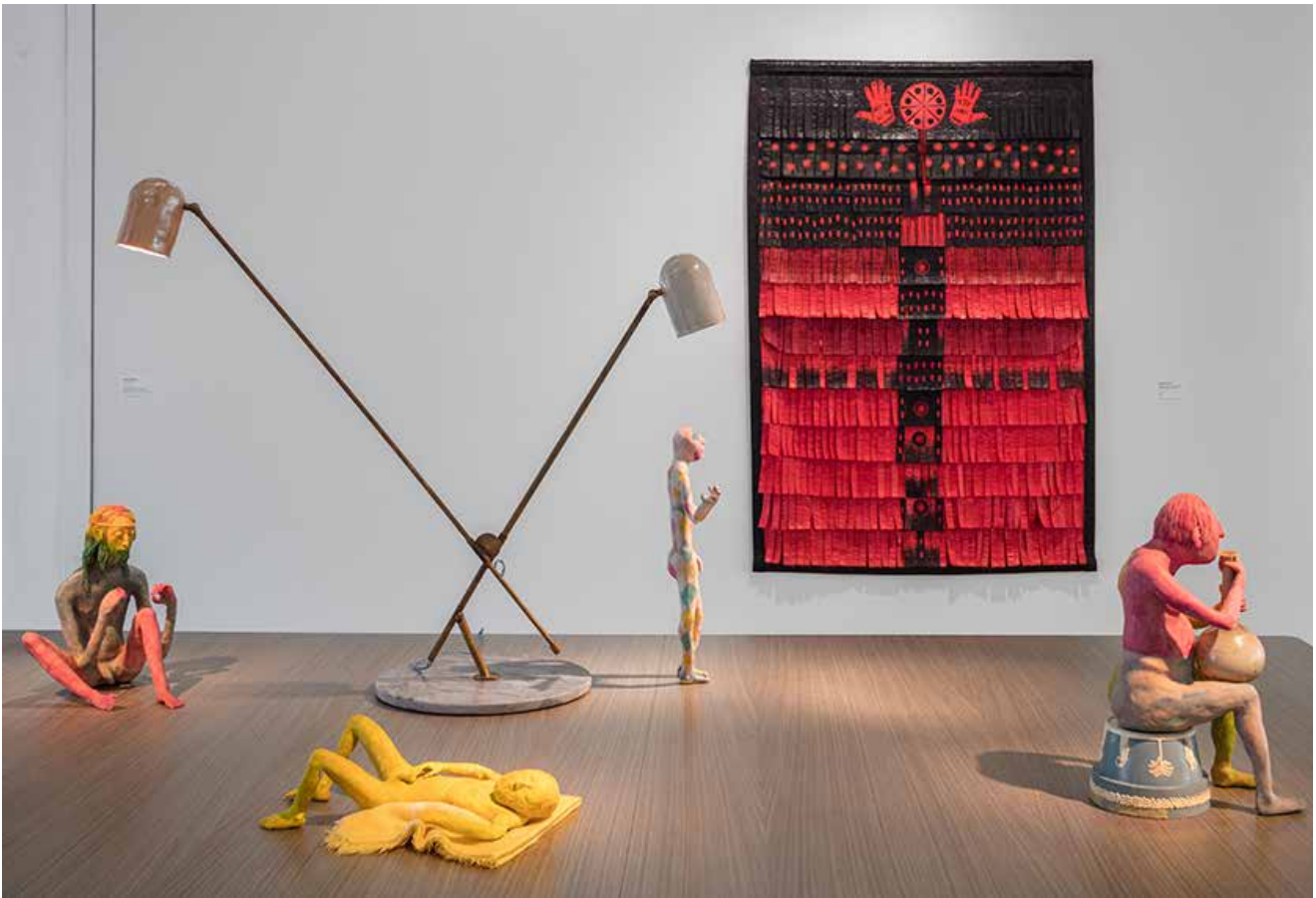
Installationsvy, Bonniers Konsthall.